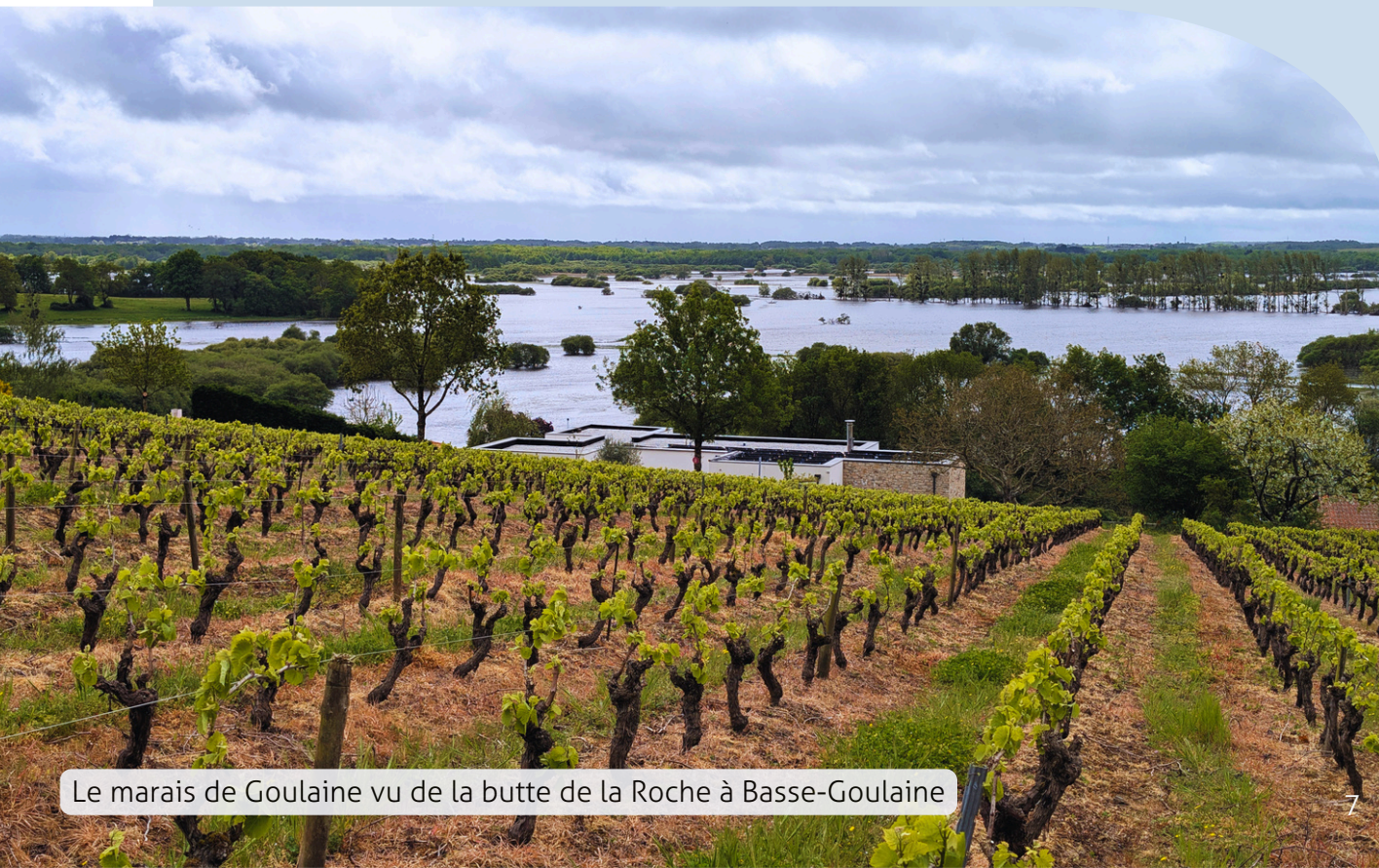
Le marais de Goulaine vu de la butte de la Roche à Basse-Goulaine