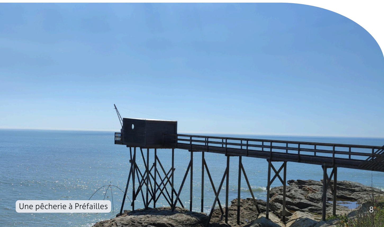
Une pêcherie à Préfailles