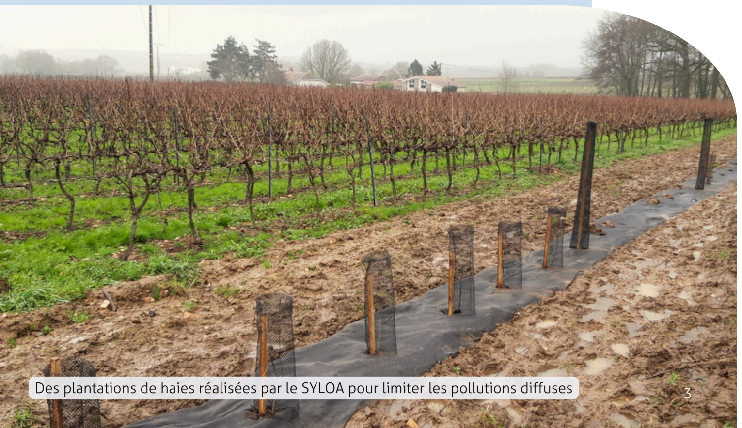
Des plantations de haies réalisées par le SYLOA pour limiter les pollutions diffuses